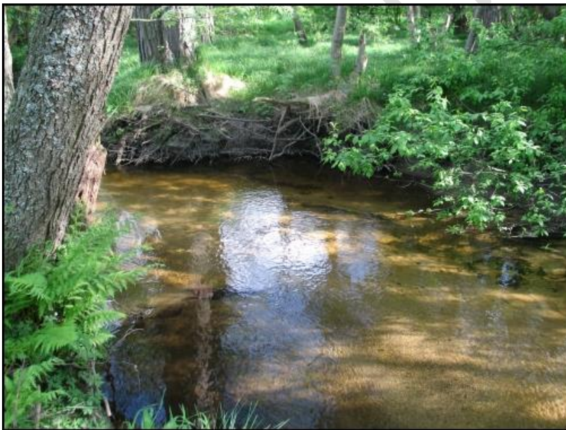
Obr. 1. Řeka Blanice – biotop perlorodky říční

Na území České republiky (ČR) se vyskytuje mnoho rostlinných i živočišných druhů, jež jsou ohroženy vyhnutím. Cílem ochrany přírody je zajistit, aby všechny tyto druhy zůstaly součástí naší přírody. Cesty k dosažení tohoto cíle mohou být různé – od pasivní (legislativní) ochrany přes vymezování chráněných území až po zabezpečování potřebného managementu. Pro některé druhy však tyto nástroje samy o sobě nestačí a je nutné jejich pečlivé doplnění a sladění s dalšími typy opatření, včetně např. rozmnožení druhu v zajetí a jeho opětovného vypuštění (vysazení) do přírody. Pro tyto druhy se připravují záchranné programy (ZP). Tyto ZP zaměřené na zachování ohrožených druhů jsou velmi oblíbeným nástrojem, stále častěji používaným u nás i v zahraničí [2]. Výhodou ZP je např. to, že ochrana jednoho konkrétního druhu má často pozitivní vliv i na ostatní druhy obývající stejný biotop – jde o koncept deštníkového druhu [3].