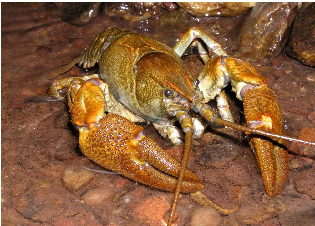
Obr. 4. Rak kamenáč

Jak již bylo řečeno, vodní toky jsou celosvětově jedním z nejohroženějších druhů biotopů. Představují komplexní a na změny velmi citlivé prostředí, které je domovem obrovského množství chráněných i nechráněných druhů rostlin i živočichů. Ochranou zvláště chráněných druhů, jakými jsou perlorodka říční a rak kamenáč, chráníme všechny živočišné i rostlinné druhy vázané na tento biotop. Svou citlivostí na podmínky prostředí a bioindikačními schopnostmi se perlorodka i rak kamenáč stávají velmi důležitými deštníkovými druhy pro vodní biotopy [3, 4, 10].