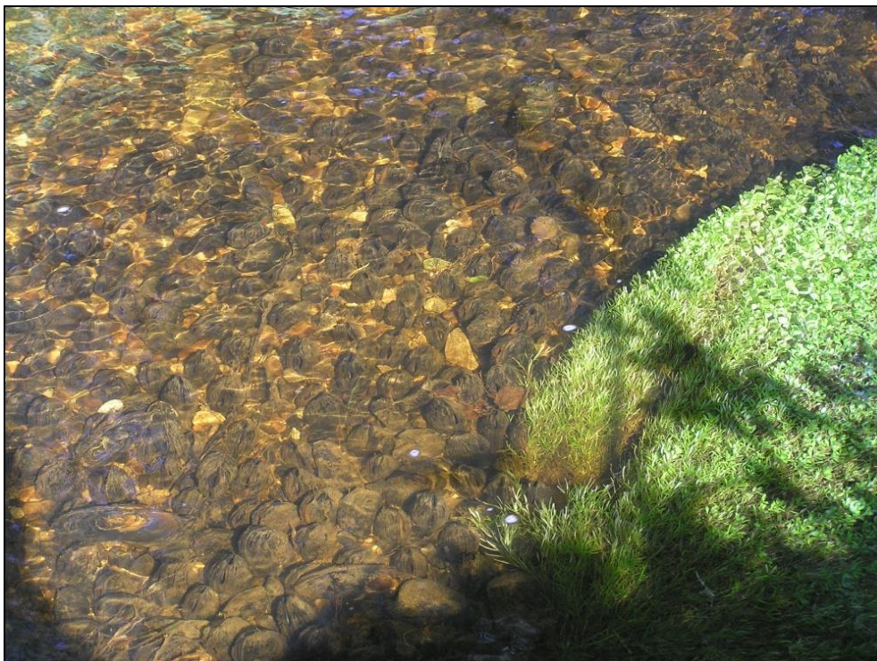
Obr. 3. Kolonie perlorodky říční