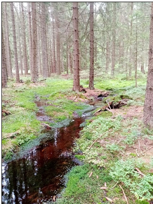
Obr. 4. Ukázka biotopu raka kamenáče (CHKO Brdy)

Přestože račí mor je velkou hrozbou, ztráta biotopu bývá často zásadnějším problémem; má nicméně mnohem vyšší potenciál k odstranění. Jde o nevhodné zásahy do koryt vodních toků, znečištění vody či zanášení koryt jemnozrnným materiálem. I tyto negativní faktory stojí za zánikem několika lokalit s výskytem raka kamenáče [10, 16].